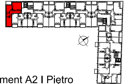
Segment A2 I Piętro

SEMACO II Sp. z o.o. Sp. K. ul. Saska 9/6 30-715 Kraków tel: 12 290 53 06 www.solarispark.pl