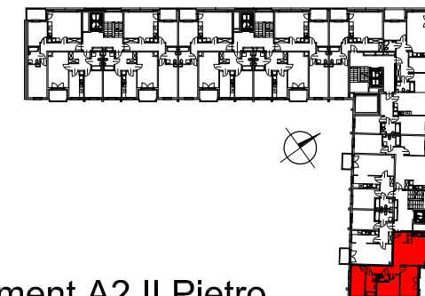
Segment A2 II Piętro

SEMACO II Sp. z o.o. Sp. K. ul. Saska 9/6 30-715 Kraków tel: 12 290 53 06 www.solarispark.pl