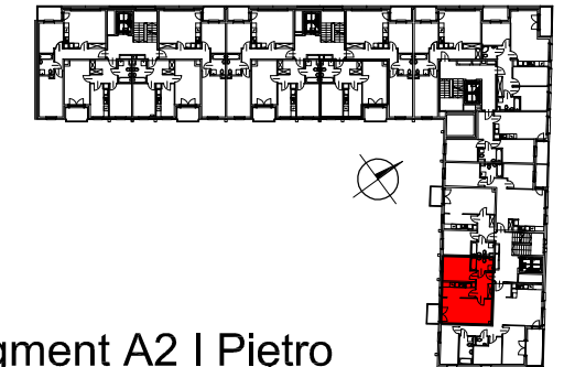
Segment A2 I Piętro

SEMACO II Sp. z o.o. Sp. K. ul. Saska 9/6 30-715 Kraków tel: 12 290 53 06 www.solarispark.pl