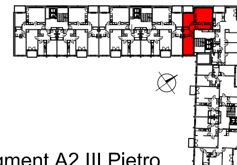
Segment A2 III Piętro

SEMACO II Sp. z o.o. Sp. K. ul. Saska 9/6 30-715 Kraków tel: 12 290 53 06 www.solarispark.pl