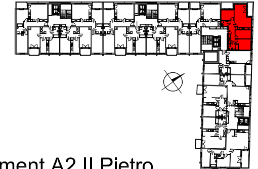
Segment A2 II Piętro

SEMACO II Sp. z o.o. Sp. K. ul. Saska 9/6 30-715 Kraków tel: 12 290 53 06 www.solarispark.pl