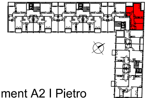
Segment A2 I Piętro

SEMACO II Sp. z o.o. Sp. K. ul. Saska 9/6 30-715 Kraków tel: 12 290 53 06 www.solarispark.pl