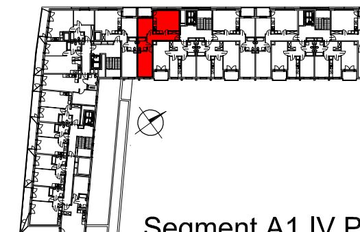
Segment A1 IV Piętro

SEMACO II Sp. z o.o. Sp. K. ul. Saska 9/6 30-715 Kraków tel: 12 290 53 06 www.solarispark.pl