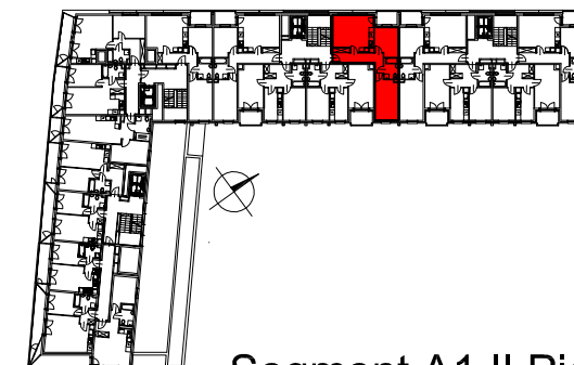
Segment A1 II Piętro

SEMACO II Sp. z o.o. Sp. K. ul. Saska 9/6 30-715 Kraków tel: 12 290 53 06 www.solarispark.pl