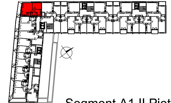
Segment A1 II Piętro

SEMACO II Sp. z o.o. Sp. K. ul. Saska 9/6 30-715 Kraków tel: 12 290 53 06 www.solarispark.pl