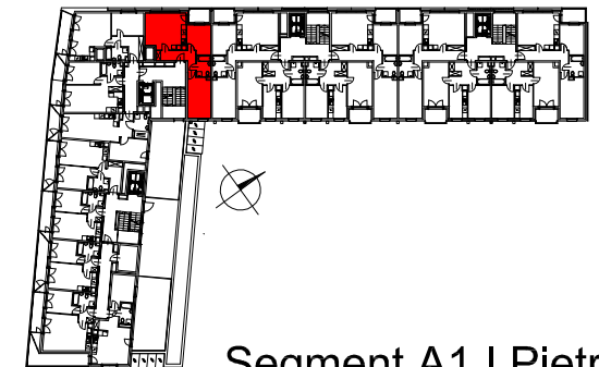
Segment A1 I Piętro

SEMACO II Sp. z o.o. Sp. K. ul. Saska 9/6 30-715 Kraków tel: 12 290 53 06 www.solarispark.pl