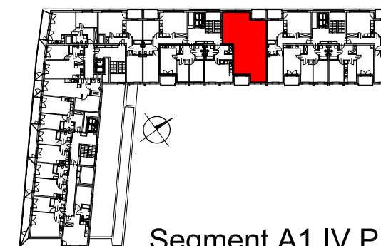
Segment A1 IV Piętro

SEMACO II Sp. z o.o. Sp. K. ul. Saska 9/6 30-715 Kraków tel: 12 290 53 06 www.solarispark.pl