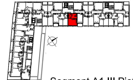
Segment A1 III Piętro

SEMACO II Sp. z o.o. Sp. K. ul. Saska 9/6 30-715 Kraków tel: 12 290 53 06 www.solarispark.pl