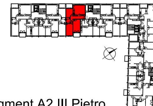
Segment A2 III Piętro

SEMACO II Sp. z o.o. Sp. K. ul. Saska 9/6 30-715 Kraków tel: 12 290 53 06 www.solarispark.pl